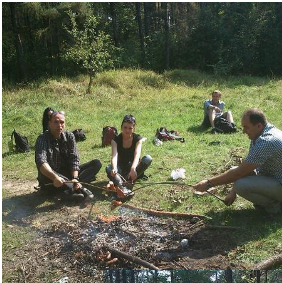
Wspólne pieczenie kielbasek