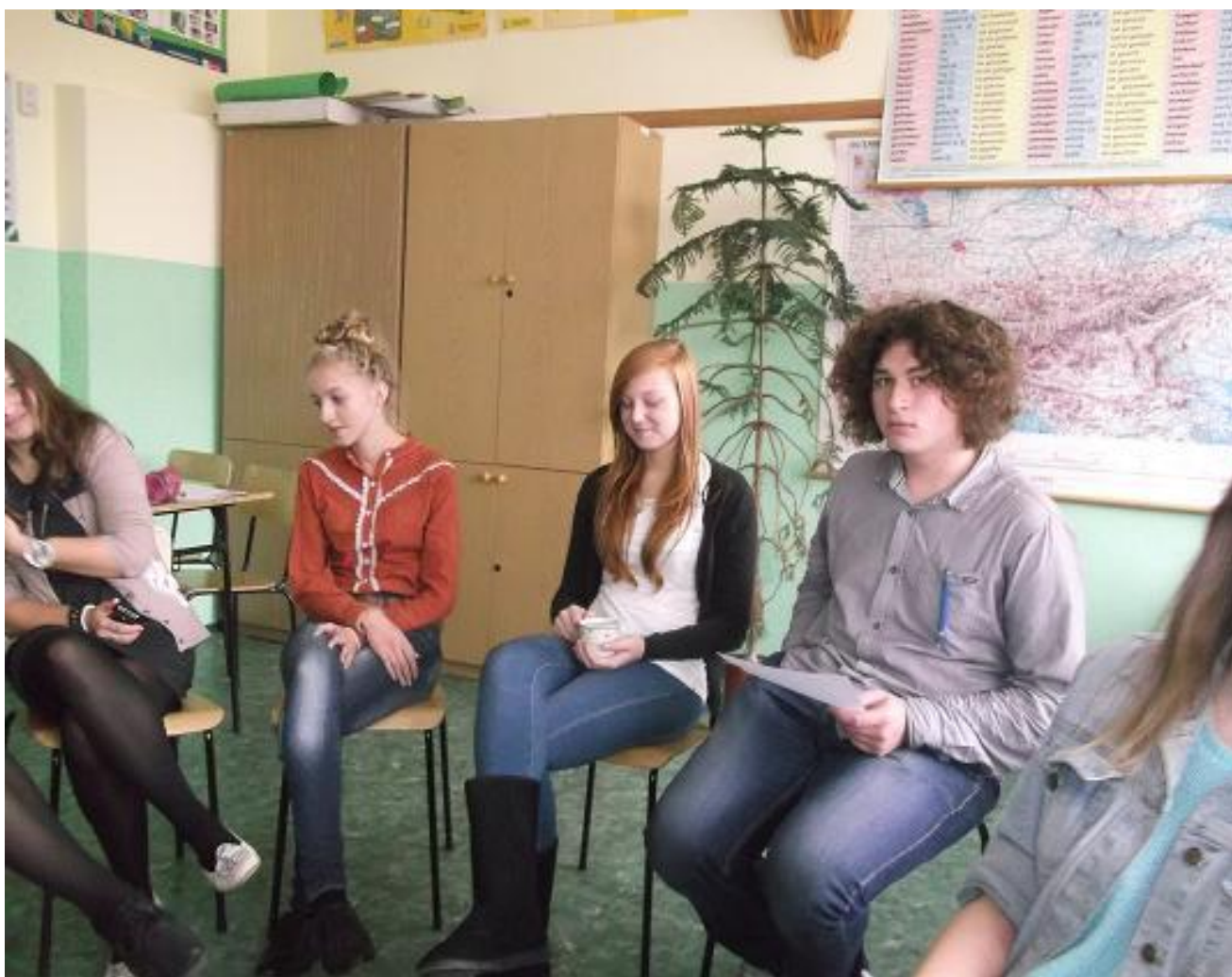
(Uczniowie należący do Szkolnego Koła Wolontariatu podczas warsztatów)

Równoległe do podejmowanych działań prowadzona jest kampania na rzecz popularyzacji wolontariatu. Na zakończenie projektu przewidziano dla 10 najaktywniejszych wolontariuszy czterodniową wizytę studyjną we Włoszech. Będzie to forma nagrody dla nich za zaangażowanie w pracę społeczną, ale również motywacja do dalszego działania i możliwość zdobycia doświadczeń na polu międzynarodowym.