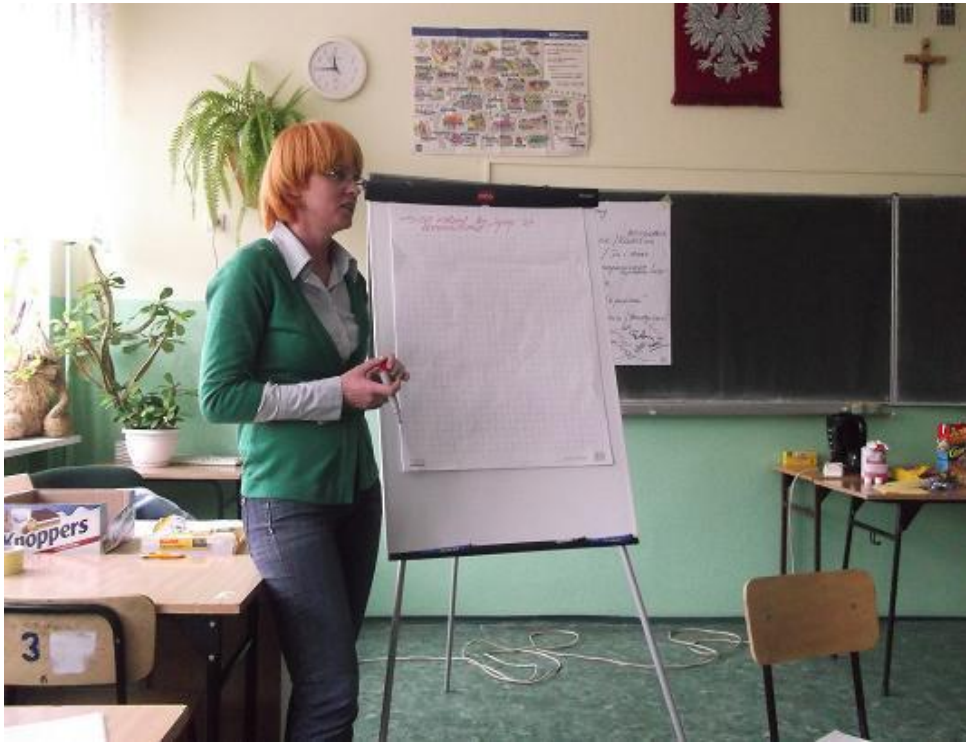
(zajęcia w ramach warsztatów Szkolnego Koła Wolontariatu)

2. Szkolne Koło Wolontariatu przy VIII LO Samorządowym przystąpiło w roku szk.2012-2013 do projektu pt. ” Wolontariat- nowe podejście- lepsze rezultaty”. Głównym celem projektu, przewidzianego do realizacji w latach 2012- 2014, jest wypracowanie i wdrożenie działań wolontariatu zapobiegających zjawisku wykluczenia społecznego. Projekt skierowany jest m.in. do uczniów sześciu liceów ogólnokształcących z Częstochowy, którzy przystąpią jednocześnie do Śląskiej Akademii Wolontariatu. W ramach projektu uczniowie-wolontariusze uczestniczą w zajęciach, przygotowujących ich do pracy z osobami potrzebującymi wsparcia. Szkolenia rozpoczęły się w drugiej połowie października 2012r. Podczas cyklu szkoleń uczestnicy dowiedzieli się, co to jest wolontariat i w jakiej formie można go pełnić oraz jakie są prawa i obowiązki wolontariusza. Podjęty został również temat stereotypów, dotyczących grup zagrożonych wykluczeniem społecznym oraz metod pracy z nimi. Dodatkowo wolontariusze mieli możliwość podniesienia umiejętności interpersonalnych- poznali swój styl komunikacji, nauczyli się w asertywny sposób przyjmować oceny, wyrażać pozytywne i negatywne uczucia bez naruszania praw innych.